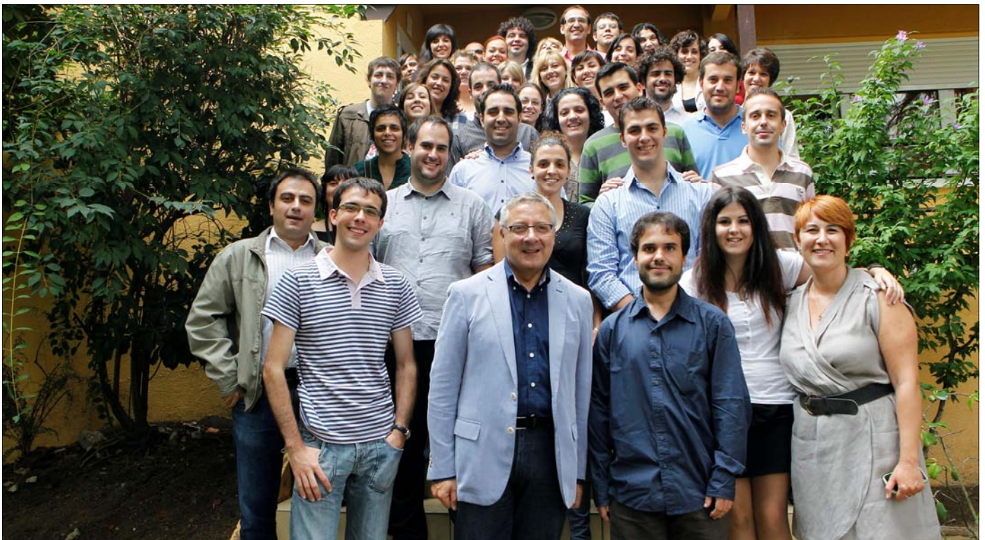
José Blanco se fotografió con los asistentes a esta actividad tradicional en la programación formativa de la Jaime Vera

E l vicesecretario general del PSOE y ministro de Fomento, José Blanco, aseguró el pasado sábado que el objetivo fundamental que persiguen las reformas impulsadas por el Gobierno socialista "es garantizar la recuperación económica y el Estado del Bienestar en el que creemos".