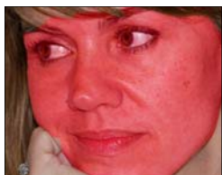
María Dolores de Cospedal...

Andan los del PP muy nerviosos y se les nota la ansiedad. ¡A seguir sonronjándoles!