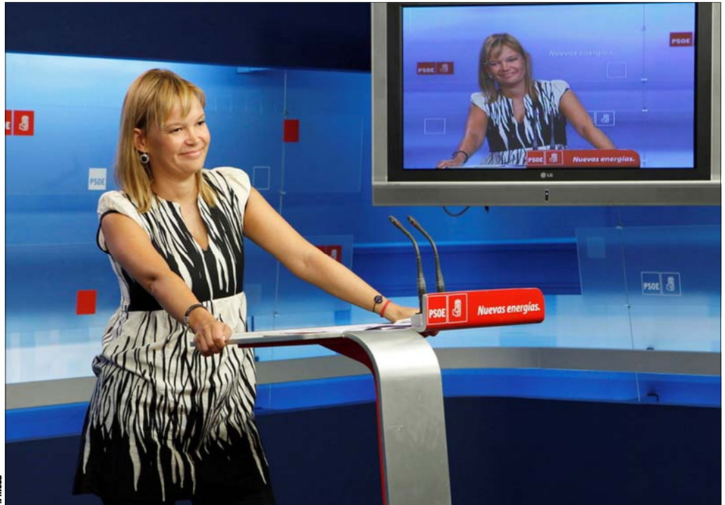
Leire Pajín, en rueda de prensa este lunes en Ferraz, tras la reunión de la Comisión Permanente

En ese camino -explicó la responsable federal de Organización- los socialistas han tenido que tomar "decisiones muy difíciles" e incluso pedir "un esfuerzo adicional a aquellos que estaban en mejores condiciones, a favor de quienes peor lo estaban